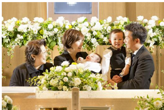
ここから笑顔で送るご葬儀とは？

たとえば、葬儀費用など、葬儀社によって見積もり算出方法が異なり、何を頼めばよいのか、総額費用がどれくらいになるのか等、多くの方が疑問を持たれています。すなわち「葬儀のこと」を改めて知る機会が求められております。平和の森会館運営グループでは、区民の皆様の「人生の終わりをより良いものとするため、事前に準備を行うため」の一助として、役に立つ葬儀セミナーを開催いたします。ご家族、ご近隣、ご友人の皆様とお誘いあわせの上、お気軽にご参加ください。