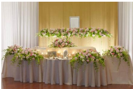
明朗会計なご葬儀とは？