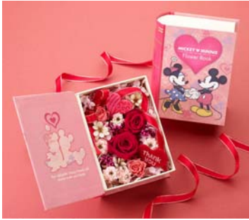
ディズニー フラワーブック 『ミッキー&ミニー サンクスハート』 6,300 円(税込・送料別)

本を開けると一面花で覆われたミッキーとミニーの世界が広がる日比谷花壇オリジナルの洋書型プリザーブドアレンジメント。赤いプリザーブドローズをメインに、アートフラワー、ドライフラワーとともにデザインし、「Thank you」のピックを添えています。