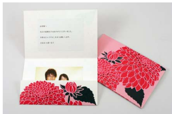
母の日ギフト限定商品につけることができる画像付きメッセージカード

「画像付きメッセージカード」は、商品注文時にオリジナルメッセージ(100文字以内)を登録いただくとともに、注文後4日以内に当社から届くEメールにしたがって、画像1点(1MB以内、縦:横=3:4の画像)の登録を行うことで、オリジナルメッセージを印字したシール付きの母の日ギフト特製カードに、画像をプリントしたカードを挟み込む形で、商品に同梱されます。